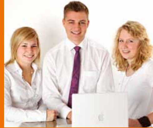
Die neuen Azubis: Seite 2