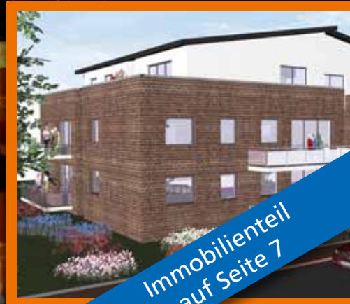
Immobilienteil auf Seite 7